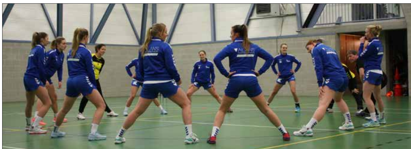
Rekken en strekken, als onderdeel van de warming up.