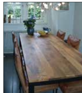
Oude tafel / nieuwe vormgeving

dierbare werkstuk. 'Mijn moeder leefde eenvoudig en had het niet breed. Vaak grapte ik: "Mam, als je dood gaat, timmer ik wel een kistje voor je." Toen ruim een jaar geleden haar gezondheid achteruitging en haar einde naderde, heb ik een kist gemaakt van licht hout en mooi bekleed naar haar wens. Technisch is dat niet zo ingewikkeld, maar voor mij was het zeker het meest bijzondere project wat ik ooit gemaakt heb.' ➔