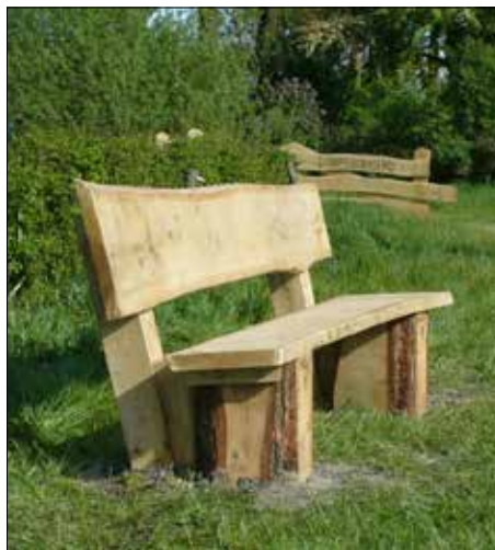
Bank Dorpsbongerd Lettele