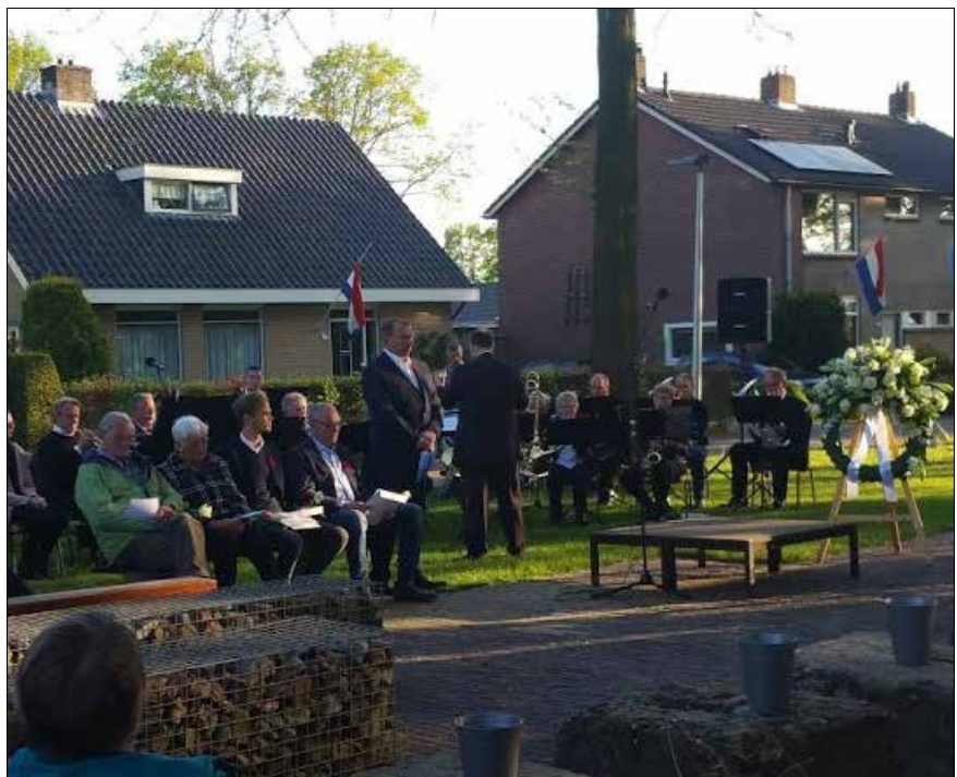
Dodenherdenking in Lettele bij het oorlogsmonument