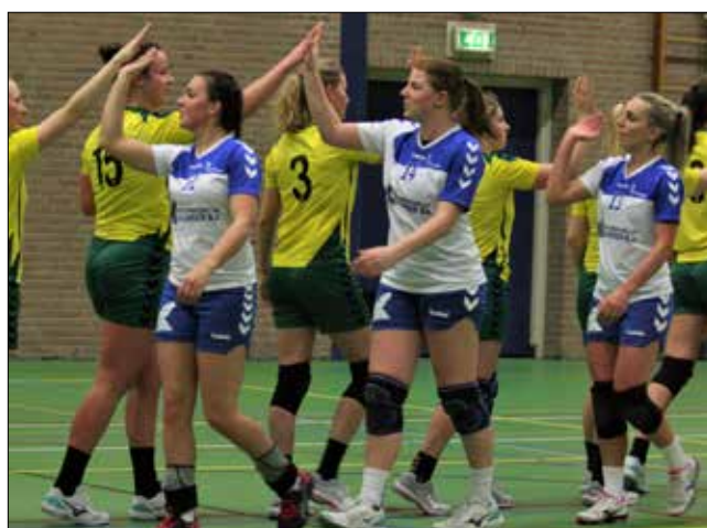
Een felicitatie en een bedankje na de wedstrijd.