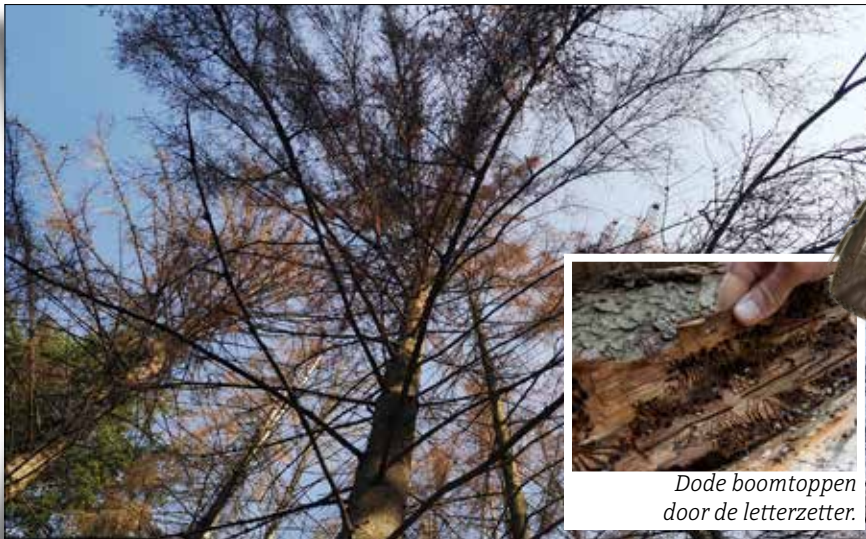
Dode boomtoppen door de letterzetter.