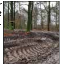
Sporen in het bos door machines voor groot onderhoud.