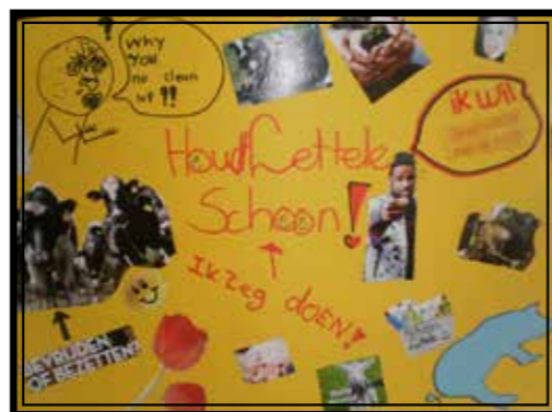
De poster is gemaakt door een groep leerlingen van het vmbo bij de mas-stage.

Wilt u meewerken met de Werkgroep Lettele Schoon? Neem dan contact met ons op: (0570) 551 709.